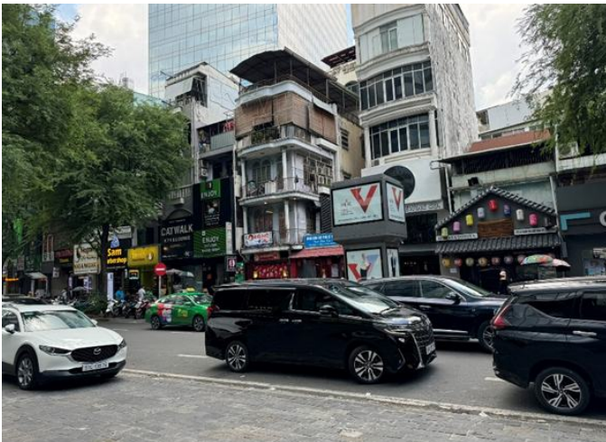
○ベトナム・ホーチミン市内 高価格帯の日本車が多くみられた

企業経営においては、このような国際情勢の変化を捉えて、将来のリスクシナリオを描き、余力のあるうちに次の一手を検討する必要がある。即ち、近い将来、国内人材はおろか、外国人材でさえも容易に確保できない状況が到来する可能性を踏まえて、事業継続のための経営戦略を練るべきであろう。