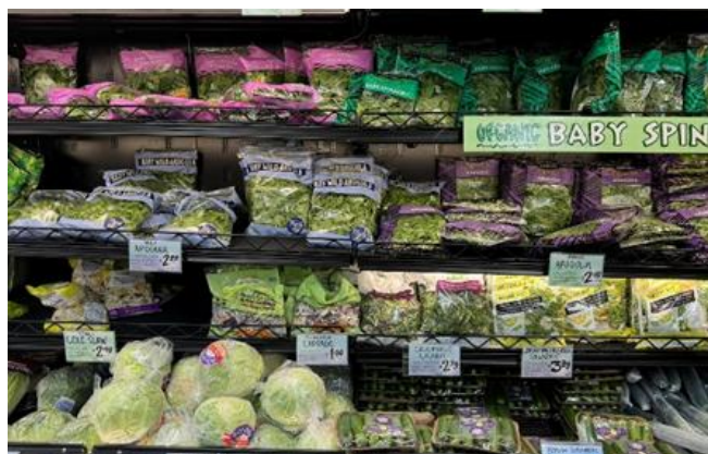
○ニューヨークのスーパーマーケットにて物価はピーク時から落ち着いたものの円安進行もあり日本の1.5~2倍の価格水準

本データから、いかに日本が安く、アジアの新興国であるベトナムとも物価差がない状況となっているか理解できる。実際に、訪問国のスーパーマーケット等において実施した物価調査では、生鮮食料品、飲料、生活雑貨、日用品において、米国・英国・シンガポールは日本の概ね2倍程度、ベトナムではビッグマック指数のとおり、日本との物価差はほ感じられない状況である。