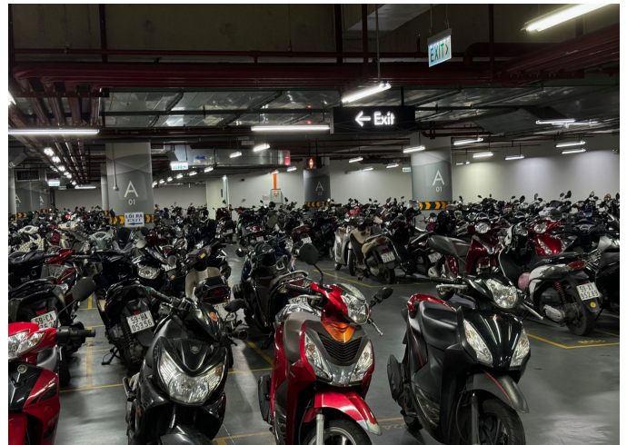
○駐車場内を埋め尽くす無数のバイク